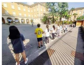
Alunni della scuola paritaria Paolo VI di Torre Boldone

nea il preside - è stato per tutti, ma soprattutto per i bambini, un bel momento di unione e di condivisione di quello che stavano vivendo». L'iniziativa è arrivata poi alle orecchie di Papa Francesco che all'inizio di quest'anno ha inviato alle due scuole la sua benedizione tramite una pergamena celebrativa. «È indescrivibile l'emozione provata dai bambini quando hanno visto la pergamena - ricorda il dirigente -. Non stavano più nella pelle dalla felicità anche perché con loro stiamo lavorando proprio