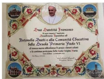
La pergamena con la benedizione di Papa Francesco alle due scuole